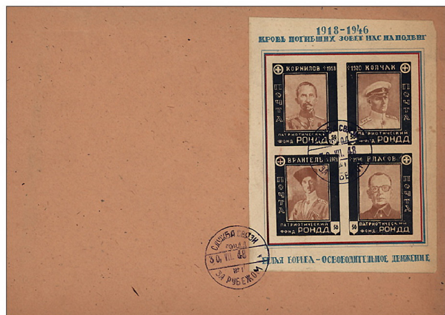
Конверт с марками Российского общенационального народно-державного движения