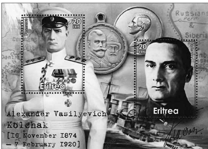
Один из двух почтовых блоков Эритреи, посвящённых А.В. Колчаку

ного рода марках тоже можно приветствовать, так как это свидетельствует об определённой популярности его как исторического персонажа.