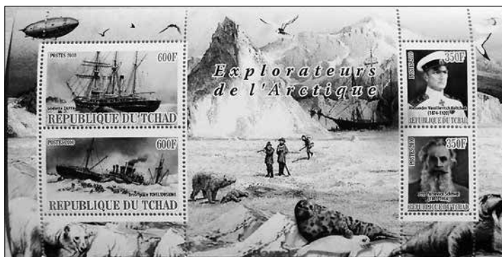
Почтовый блок Республики Чад, посвящённый полярным исследователям