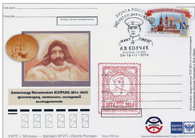
Почтовые карточки, выпущенные Почтой России к 140-летию А.В. Колчака