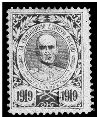
Марки, посвящённые А.В. Колчаку из «генеральской» серии, выпущенной во время Гражданской войны