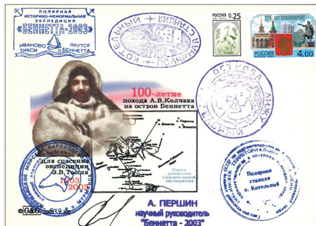
Конверт с портретом А.В. Колчака, выпущенный в 2003 г. к 100-летию спасательной экспедиции на остров Беннетта