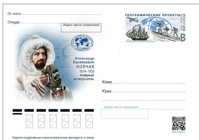
Один из проектных вариантов почтовой карточки к 150-летию А.В. Колчака