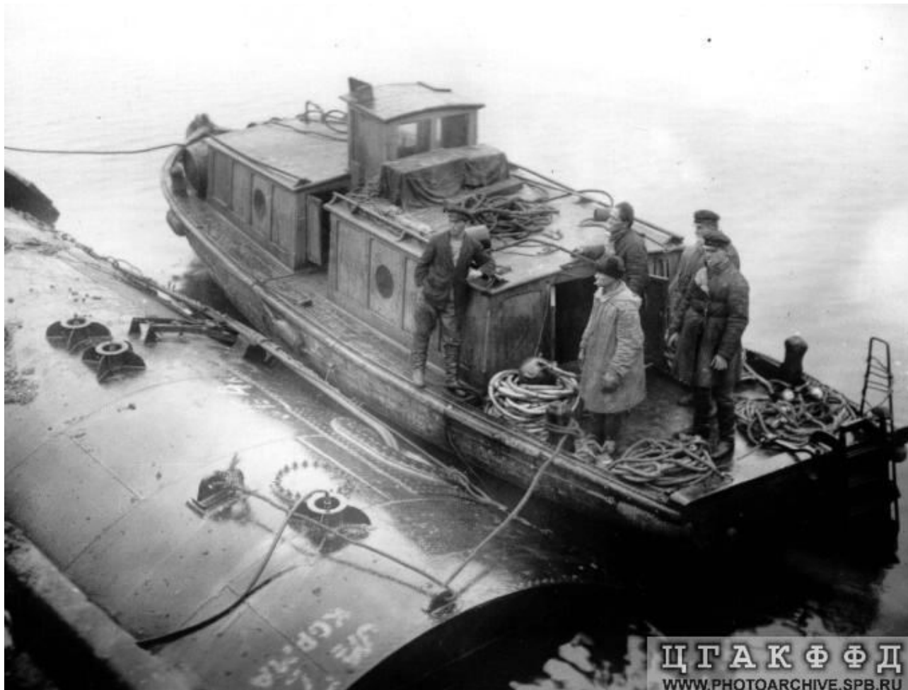
Водолазный бот подошел к «Садко» для заделывания пробоин. Diving boat approached «Sadko» to fill up holes.

А.Н. Толстой, В.Я. Шишков и Н.Н. Никитин на Кольском полуострове