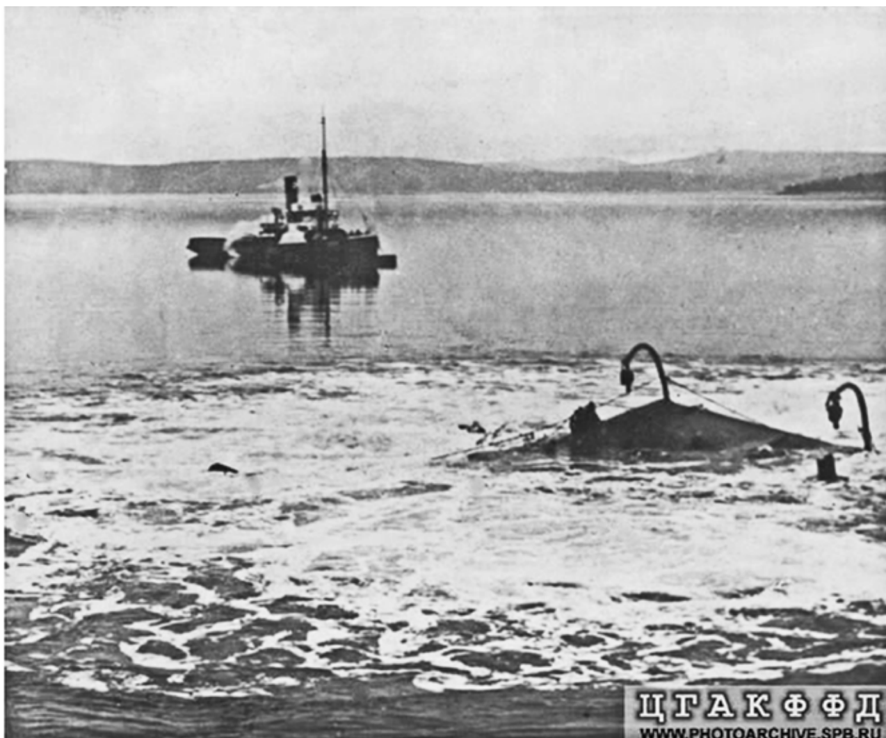
Подъём «Садко». Всплытие кормы.

«Тихий, солнечный день над огромным зеркалом Кандалакшского залива, над сурово-лиловым окаймлением гор. Неподалёку от лесистого островка стоит старый пароход «Декрет», ржавые борта его помяты, в иных местах забиты деревянными пробками. Это – основное орудие производства. «Декрет» отошёл немного в сторону от вещей, указывающих расположение носа и кормы «Садко», лежащего на глубине 35 м. Водолазный катер подведён к борту. Все предварительные работы окончены. Водолазы – на верхней палубе «Декрета». Стучит компрессор, нагнетая по резиновым шлангам последние кубометры воздуха в шесть пар двухсоттонных железных понтонов. На соеди-