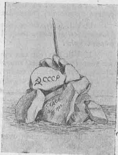
Знак на Земле Франца Иосифа.

Ледокол полным ходом двинулся на толстый пласт льда, смял, расколол и остановился—подводная часть не пустила дальше. Короткая команда: