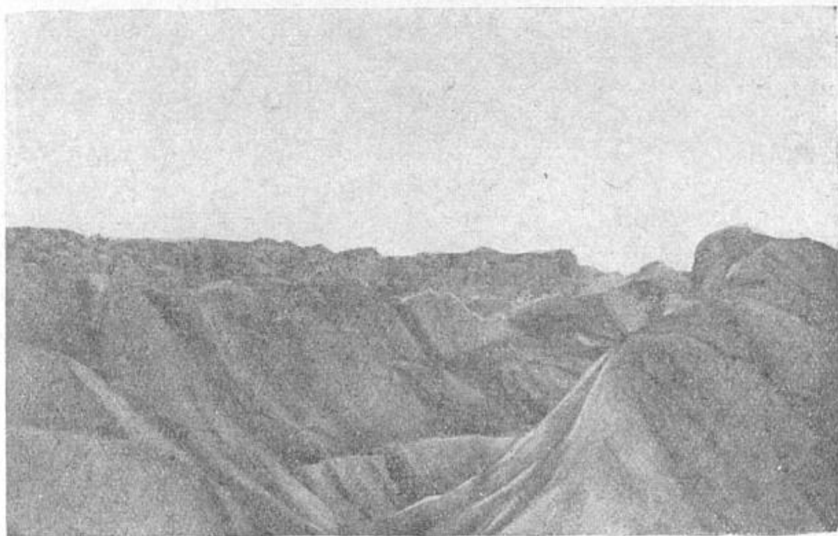
Ледник Шокальского в Русской Гавани.

Баренцовым и Карским морями узким выщербленным куском суши.