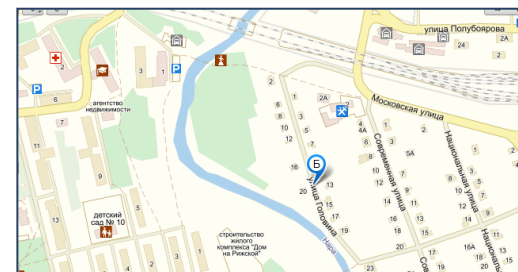
Его именем названа одна из улиц Наро-Фоминска.