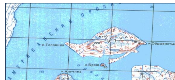
Западная точка острова Куна, расположенного в центральной части архипелага Земля Франца Иосифа— мыс Головина, названа в честь Павла Головина.