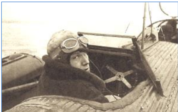
Летчик П. Г. Головин в кабине Н-166 перед перелетом Москва - остров Рудольфа.

Герой Советского Союза Выдающийся полярный летчик