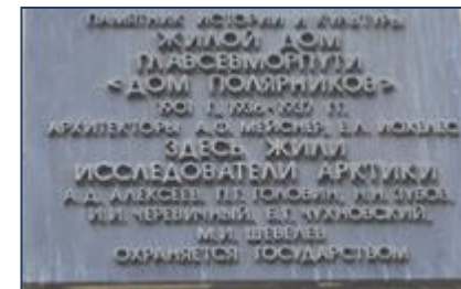
Памятная доска на доме на Никитском бульваре в Москве, построенном в 1936 году для работников Главсевморпути.