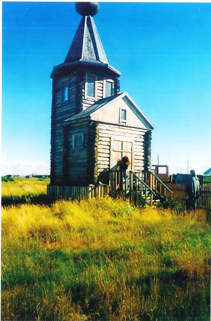
Часовенка в Походске (фото О. Чариной).