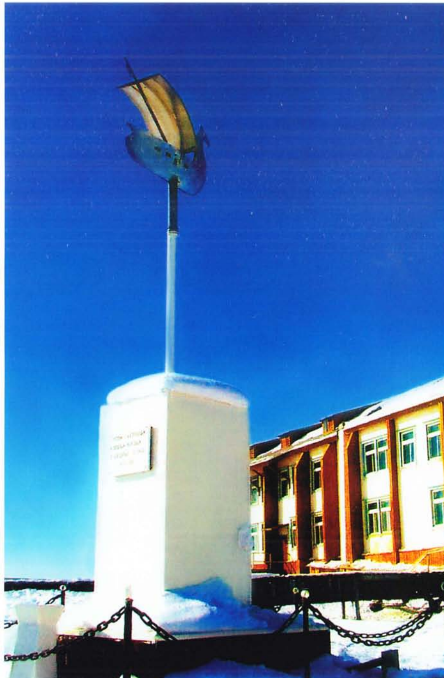
Памятник предкам-землепроходцам в Русском Устье.