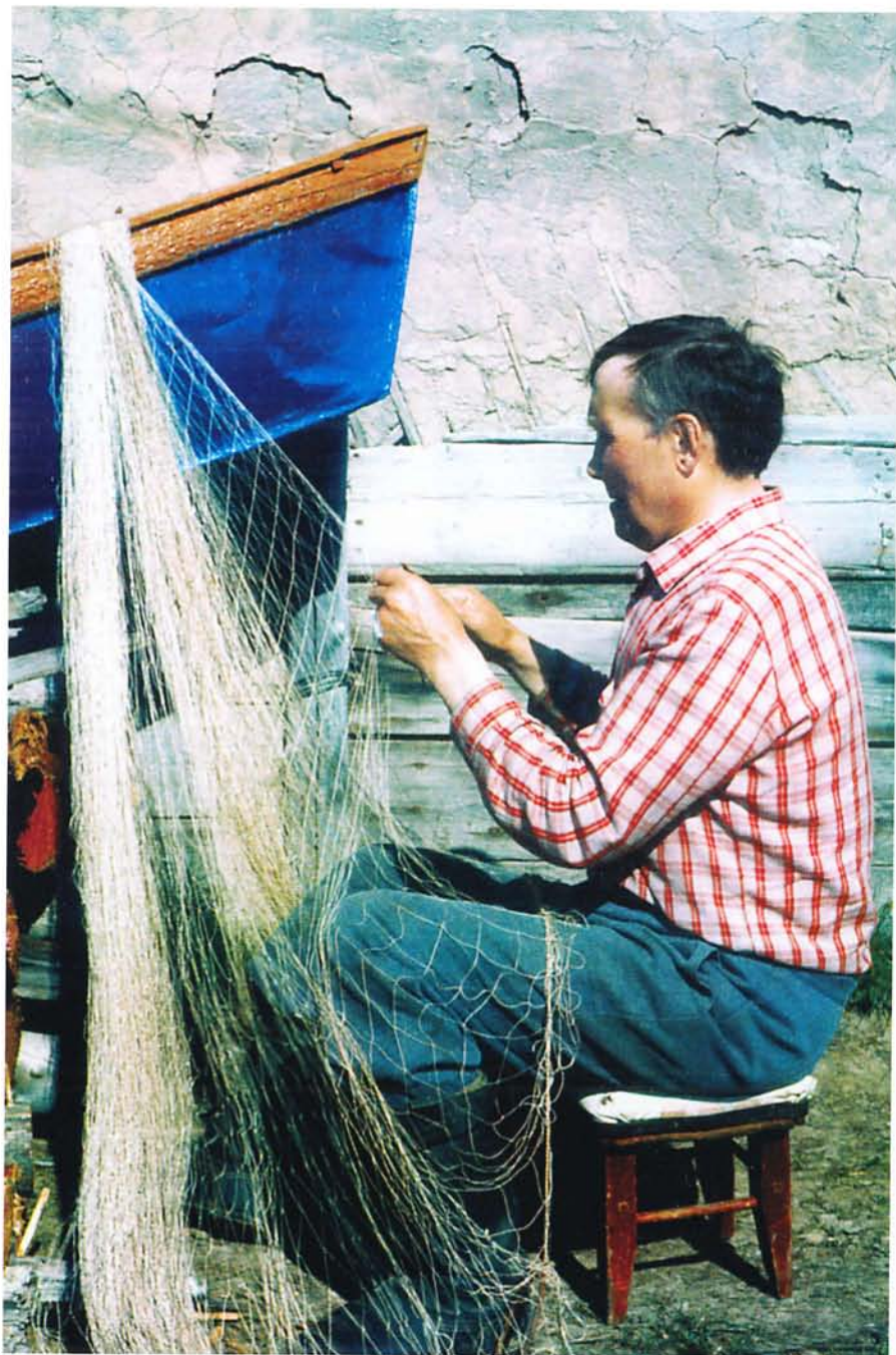
Ремонт сети.