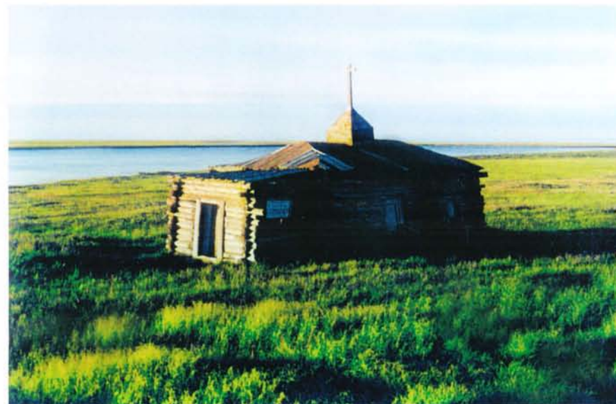
Самый северный в мире православный храм (71° с.ш.) — церквушка в местечке Станчик, в дельте Индигирки. Памятник старины начала XIX в..