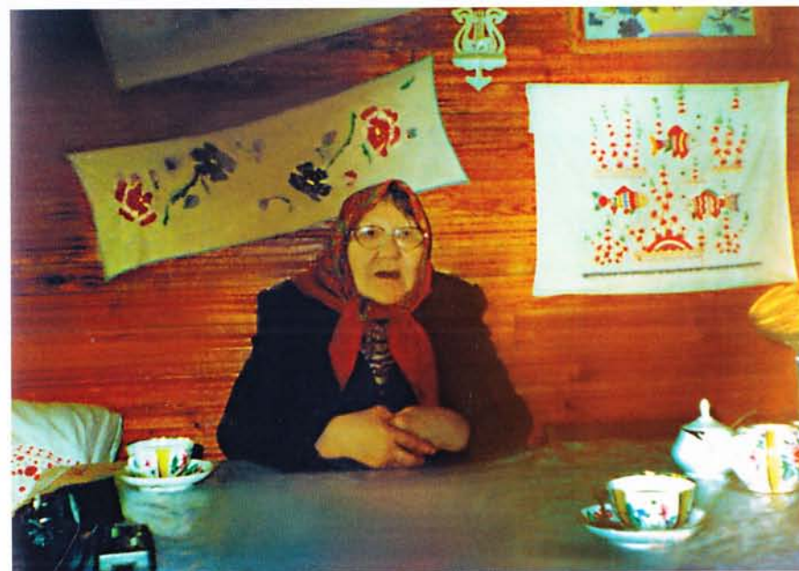
Походская сказительница.