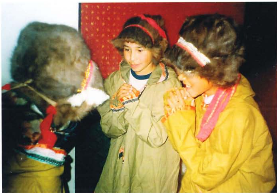
Юные походчане.