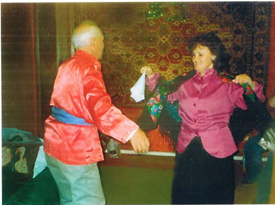
Походский танец «Рассоха».