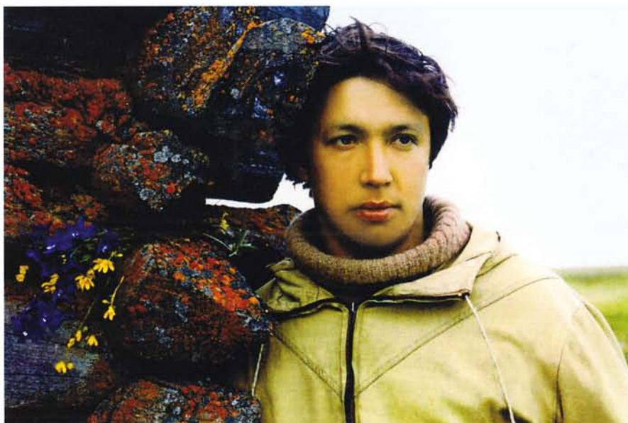
У дедовской избы.