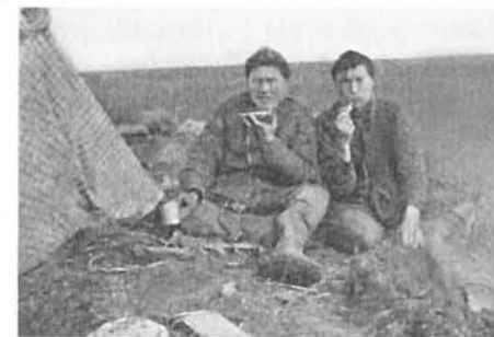
Чаюют: Микунюшка и Ванюшка, 1912 г..

Было распространено так называемое «узелковое письмо», т.е. передача сведений в виде разноцветных тряпочек с узелками. Желтый цвет означал измену, черный — печаль и недопомогание, белый и красный — радость и благополучие. Напри-