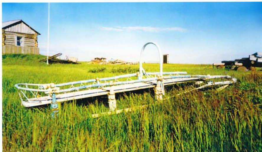
Собачья нарта — «тройка».