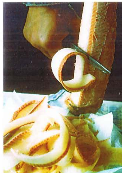
Строганина — северное «мороженое».