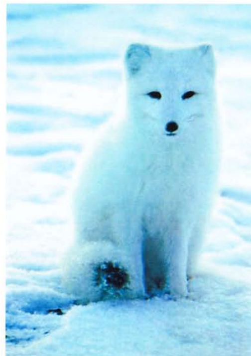
Белый песец «довел» русских до Ледовитого океана.