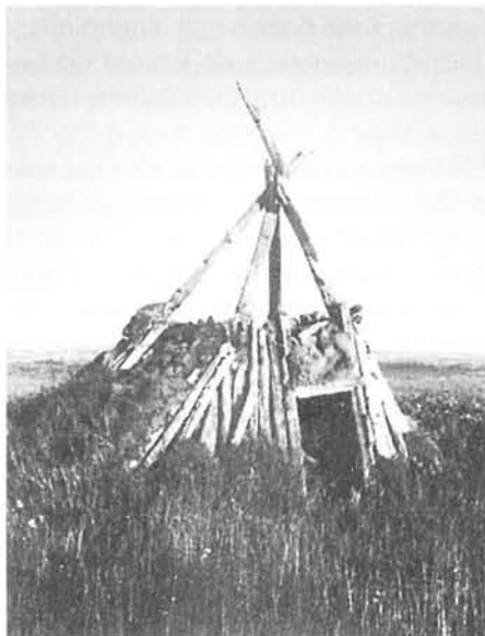
Старинная охотничья избушка — поварня.

генов. От оленя старались использовать все: внутренности шли на приманку песцов, из сухожилий делали нитки, из копыт — пуговицы и клей, из рогов — грузила для сетей, ручки для ножей и детские игрушки, шерстью набивали матрацы, скисшие внутренности использовались как раствор при выделке шкур.