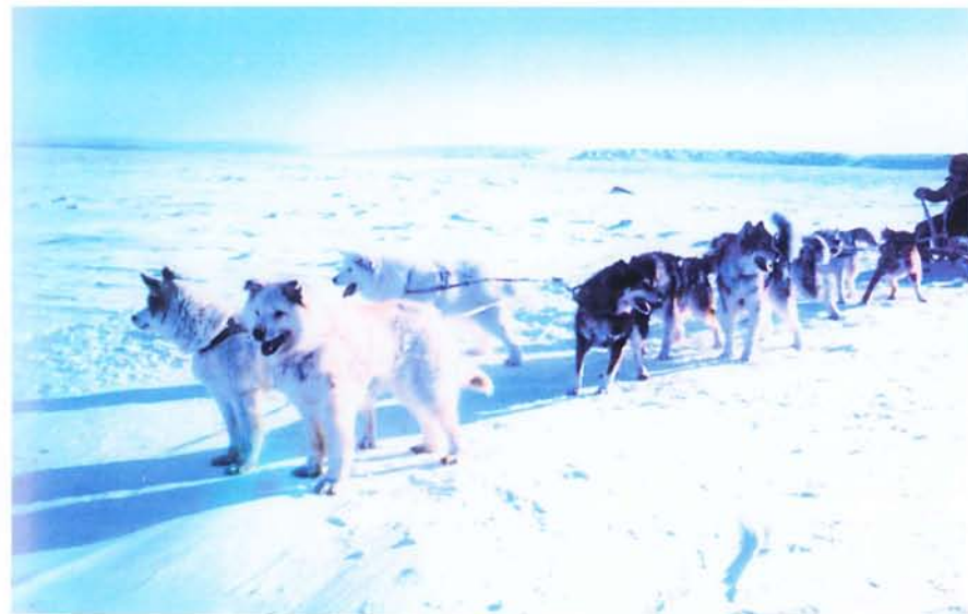
Друзья по риску.