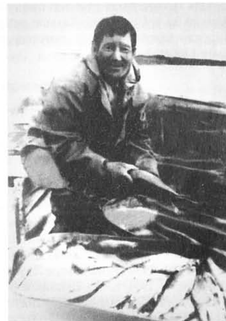
Зачем рыбу ловим — чтобы собак кормить. А зачем собак держим — чтобы рыбу возить.