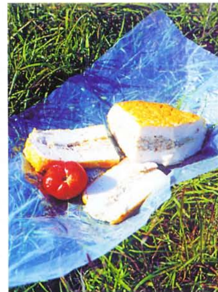
Рыбный «хлеб».