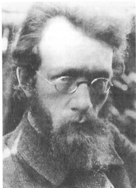
В.М. Зензинов — автор книги «Старинные люди у холодного океана», 1912 г.

Судя по материалам, подчерпнутым В.М. Зензиновым из архива мещанского старосты, в 1831 г. якуты, пришедшие на Индигирку позже русских, подали в Комиссию по переобложению инородцев жалобу на русских, захвативших, по их мнению, лучшие рыболовные места и расставивших «по лицу тундры» песцовые ловушки: «Заселились к нам несколько русских семейств, мещан упраздненного Зашиверска и Якутска, которые дошли до такой степени свободы, что, оставив свое местожительство, расселились по разным местам, инородцам принадлежащим». Иркутский губернатор дал предписание выселить с Индигирки мещан «незамедлительно и не принимая никаких отговорок» 26 .