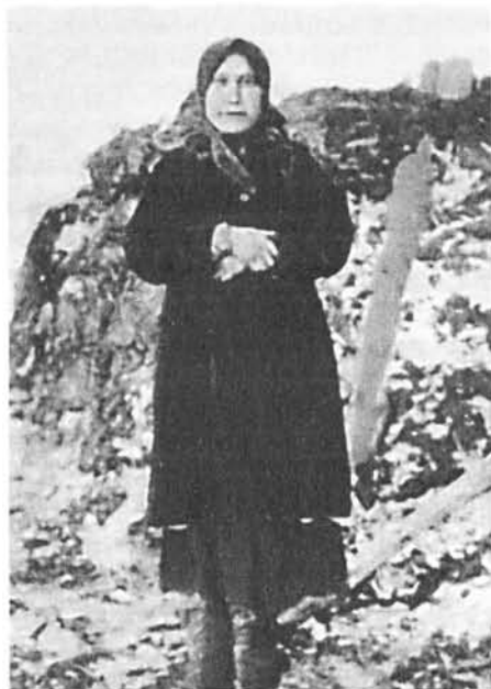
Русскоустыинская красавица, 1912 г..

Голову покрывали платком или шалью обычным русским способом, т.е. углом на спину и узлом под подбородком. Замужние женщины носили «наколку», плотно обтягивая голову платком, оставляя лоб и часть волос впереди открытыми и связывали концы платка надо лбом. Пожилые женщины носили чепчики, зимой надевали полотняный, слегка приталенный жакет с меховым воротником, подбитый изнутри песцовым мехом, манжеты, карманы и полы обшивались мехом. В дорогу надевали длинную меховую шубу, покрытую гарусом или сукном. На голову сначала повязывали тонкий платок, потом надевали «ермолку» — низкий меховой усеченный конический цилиндр с матерчатыми наушниками.