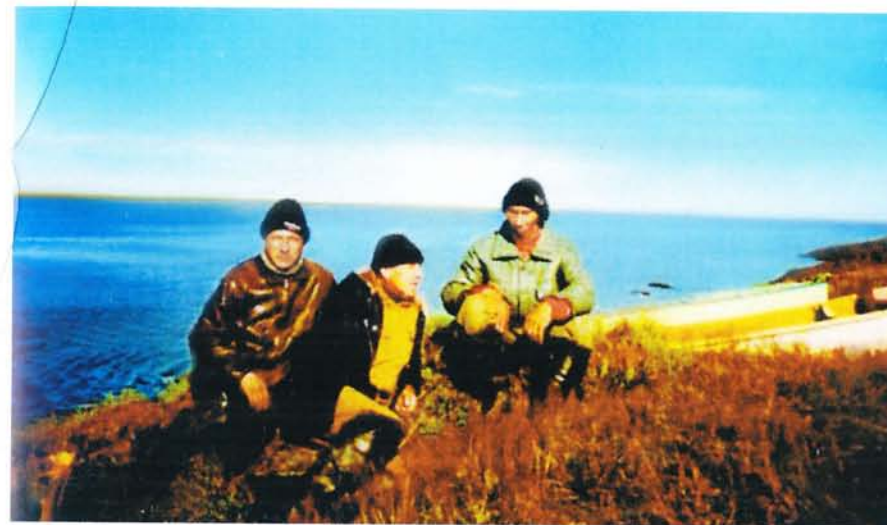
На берегу родной реки.