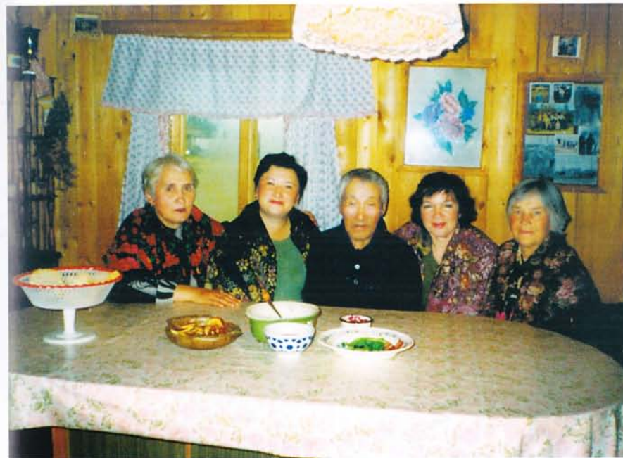
Посиделки в Походске.