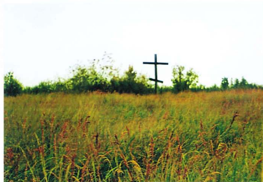
На этом месте в 1644 г. был заложен Нижнеколымский острог. Протока Стадухинская, «Старый город».