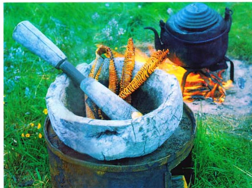
Натюрморт с юколой.