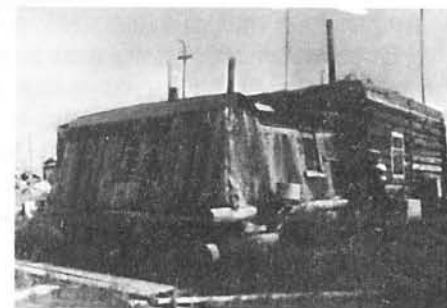
«Русская» изба.

По сведениям информантов, помещения содержались в чистоте. Полы в избе мыли горячей