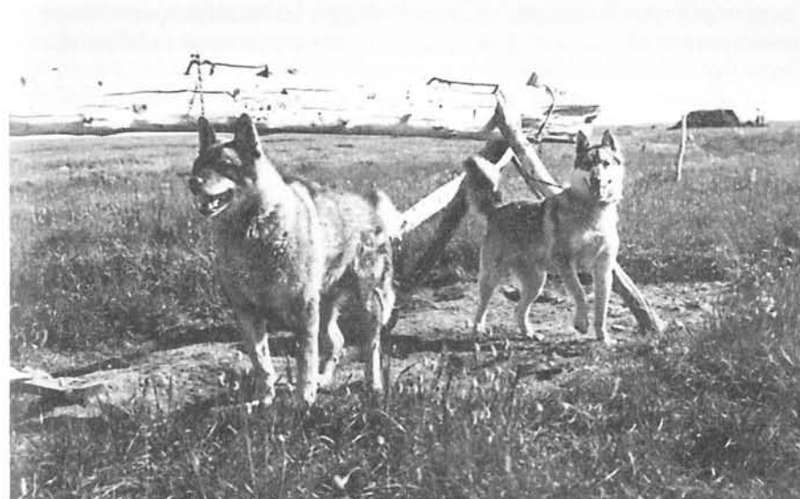
«Передовики» в летнем «отпуске».

Способ расположения собак в упряжке — парный. Собаки пристегиваются к поводку — «потягу» — попарно через 1,5 м пара от пары. Общая длина поводка на упряжку в 10 собак примерно 7 м. Собачья сбруя — «алык» — кожаная петля с двумя перемычками по середине. Лямка проходит по груди и бокам собаки. Алыки шились чаще всего из нерпичьей кожи. Впереди запрягались две лучшие собаки, одна из них — передовик. Ценность передовой собаки состоит не только в том, что она ведет упряжку и делает ее управляемой, но и в том, что в полярную ночь, в пургу она не сбивается с маршрута, заданного хозяином, на далеком расстоянии чувствует жилье и «хорошо гонит дорогу» — раз-