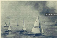
Совместные буера выжили конструктор «Бразил».

ложены две рекомендации — одну он получил по радио от Копусова из бухты Тихой, другую дал я.