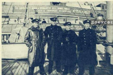
Оставшиеся ледовики на борту «Ермака».

увеличилась течь. Положение его не было опасным, однако, чтобы привести судно в порядок, мы остановились во льдах, примерно в восьмидесяти — восьмидесяти пяти милях от Ленинграда.