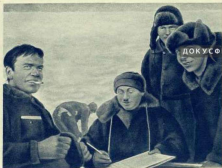
Рапорт товарищу Сталину.

— Совсем как автомобиль «Скорой помощи», — сказал Кренкель. Потом он осмотрелся, нагнулся, что-то поднял с полу, выпрямился и вышел из своего дома, исторического радиодома станции «Северный полюс».