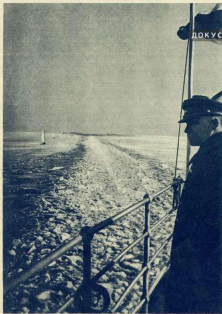
«Брідик» пробивав во льду канал.