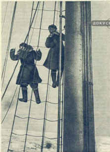
Где-то впереди лодка Папанина...