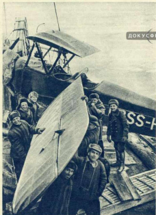
Самолет Восток спущен на воду.