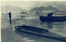
Свет на льдине растаял.

На соседних льдинах образовались огромные озера пресной воды. Одно из них танулось метром на двести. Мы обследовали его вдвоем с Женей Федоровым, проехав по озеру на байдарке.