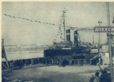
Встреча «Грома» в Ленинграде.