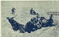
Наход ската полярной палатки.

нил цвет брезента. Он стал серо-грязным. Скаты крыши были запятнаны подтеками. Скоро из-под снега показались стены. Мы увидели на них хорошо сохранившиеся серебряные буквы: «СССР. Дрейфующая станция Галасеморпутя».