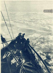
Корабль с трудом прокладывал путь во льдах.