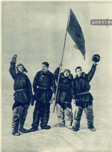
Нас встретили герои.