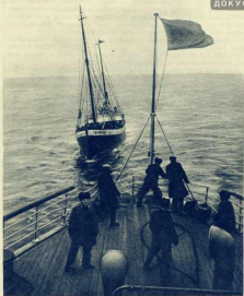
«Брига» берет «Мурманск» на буксир.