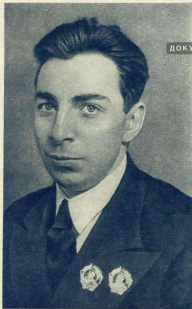
Герой Советского Союза Евгений Константинович Федоров.