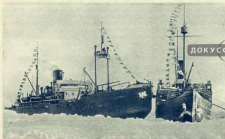
«Мурман» и «Таймир» подошли к краю льда.

заливали светом нас. На обоих кораблях собрались группы людей. Мы кричали: