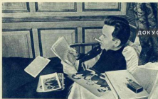
«До чего здорово лежать»

заброшена газетами. Газетные листы лежали на койках, на полу, на столе.