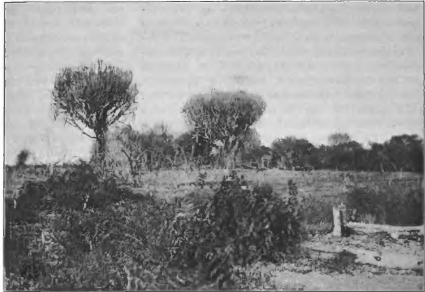
Рис. 2. Лѣсъ восточно-африканской равнины. Канделябровыя деревья.

въ гигантскихъ пальмовыхъ корзинахъ горы апельсиновъ и мандариновъ и груды сахарнаго тростника. За геллеръ можно купить апельсинъ, — баснословная дешевизна!.. Ман-