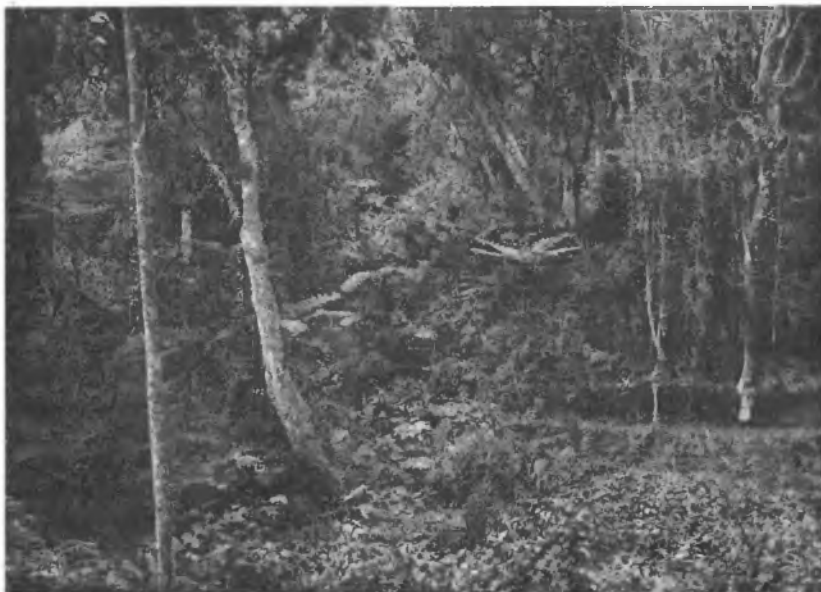
Рис. 5. Дѣвственный тропическій лѣсъ въ окрестностяхъ Амани. Слева и въ центрѣ видны громадные древовидные папоротники, справа — масса ліанъ.

Экскурсировать въ тропическомъ лѣсу не легко. Внизу постоянно—полумракъ, пробираться очень трудно, ліаны и кустистая трава заставляютъ пролагать себѣ дорогу съ помощью топора, подчасъ же заберешься въ такую гущу, что положительно нелегко