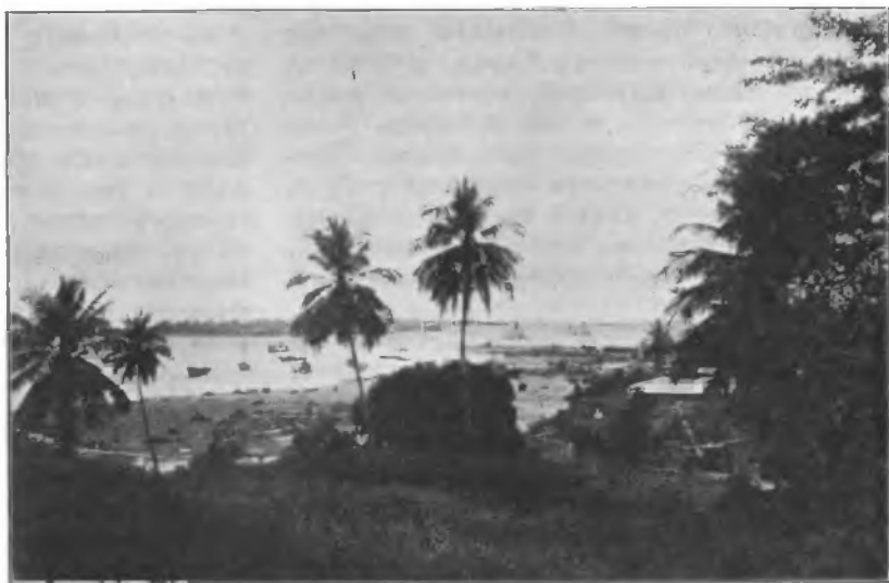
Рис. 1. Заливъ Танги. Видъ отъ города на бухту и „островъ мертвыхъ“.

— „Богъ съ нимъ, съ хорошимъ вознагражденіемъ, пускай даже хозяинъ угрожаетъ судебнымъ процессомъ за всѣ расходы, что были связаны съ моей поѣздкой, какъ -нибудь развяжусь!.. Своя жизнь дороже!“... Онъ и радуется и въ то же время съ ужа-