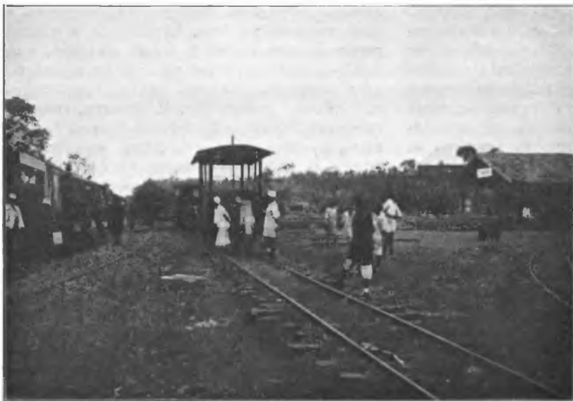
Рис. 3. Станція Тенгени. На-лѣво поѣздъ изъ Танги, на-право зданіе вокзала и вѣтвь на Сиги.

По хорошему, желѣзному мосту переѣзжаемъ черезъ каменистую, бурлящую Сиги, всю утонувшую въ зелени и вдругъ разомъ попадаемъ въ самую гущу первобытнаго, нетронутого