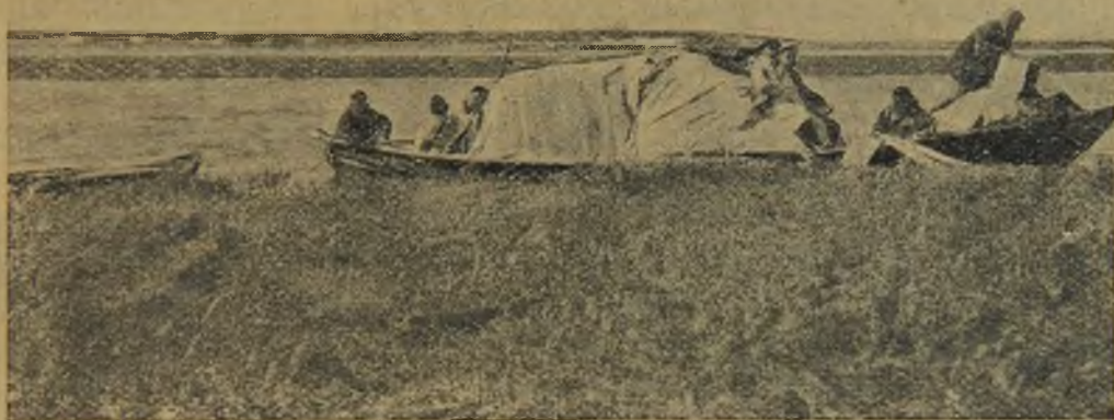
Наше отбытие в Хассейн-то.

Руководителю экспедиции — ботанику — пришлось испортить не мало крови, торгуясь со своими спутниками из-за