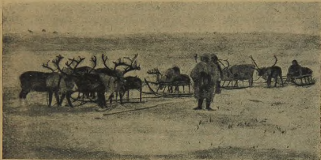
От'езд на Мачуй-сале.

Утром мы быстро собрались и отправились к северу. Исчезла и полярная березка, исчезли и тальниковые кустарники, только тонкие веточки одной ползучей ивы кое-где едва поднимаются из-под снега.