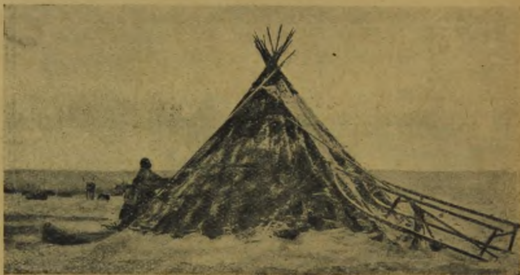
Самоедка сбивает снег с чума.

Остановка. Вытянулись цепочкой десятки нарт, в каждом анасе по 8—10 нарт. Впереди каравана мчится на легких нартах хозяин, прокладывая дорогу. Он же выбирает и место для остановки. Слезает и лопаткой «янчаги» копает снег (иногда просто рукой) и смотрит: каков здесь лишайник? Поворачивает свои санки, а за ним послушно, как овцы, повфрачивается и все стадо нарт. Останавливаемся обычно около озера или речки, где, сэкономив топливо, можно достать из-под льда воду, не тая снег. Но лед делается все толще и