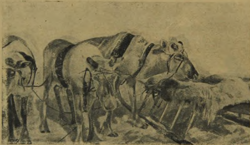
Безрогие олени весной.