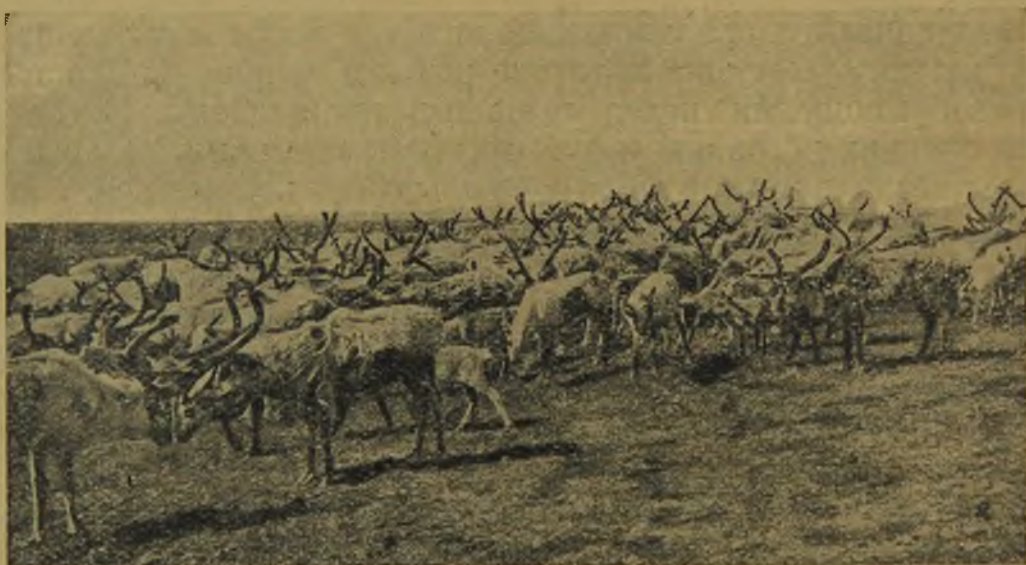
Стада Селендера. У некоторых оленей не совсем еще вылиняла шерсть.

Н г ы д а. Опыт плаванья по озеру То-нгаева показал, чем мы рискуем, если попробуем идти дальше в перегруженной лодке. Малейшее волнение среди широкого водного пространства могло потопить нас. Поэтому мы выгрузили на берег половину нашего имущества, тщательно укрыв его брезентом.