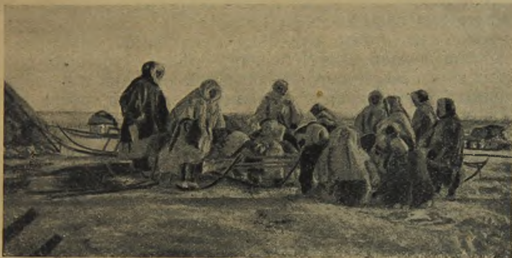
Сход у самоедов.

В начале апреля на реке Мудуй — в центре самоедских становищ — ботаник вел переговоры с самоедами, принимая подводчиков для передвижения экспедиции на север. Кроме грузовых нарт, для экспедиции требовались и нарты для дров, так как в верховьях реки Гыды не было и следов лесов. Самоеды оказались крайне не стоворчивыми подводчиками. Согласившись сегодня на наши условия, на завтра, переслав ночь в чуме и поглядев утром на своих оленей, приходили к нам и отказывались от поездки.