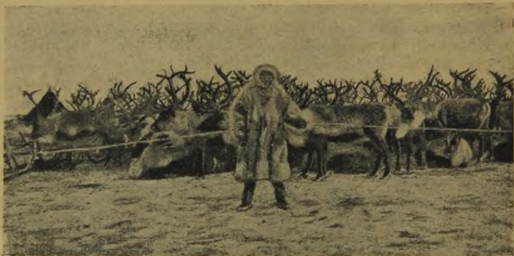
Стадо оленей согнанное для запряжки.

Недавно в одной из сибирских газет сообщалось, что самоеды называют себе подобных мужчин «юре» (друг), а женщину презрительно кличут «не-юре», то-есть недруг. Это, ко-