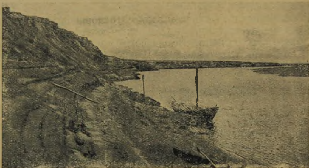
Стоянка на Юрибее.

На вершине холмов то палка с черепом оленя отмечает святое место, то спущенная пасть, безопасная для дешевой шкурки летного песка, маячит на оголенных зимними ветрами по-