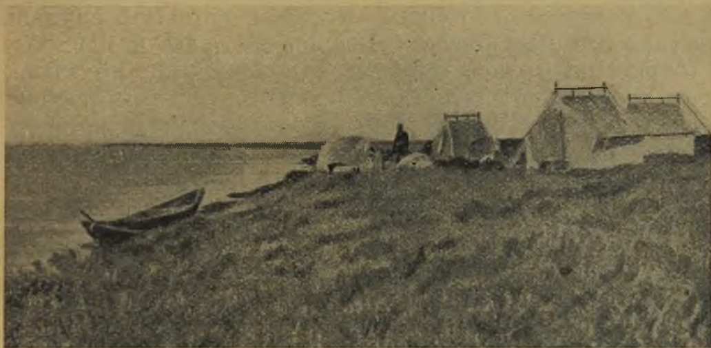
Лагерь на Юрибее.

На одном из плесов заметили стайку молодых гусей. Окружив их двумя отрядами, двигавшимися по берегу, мы часто