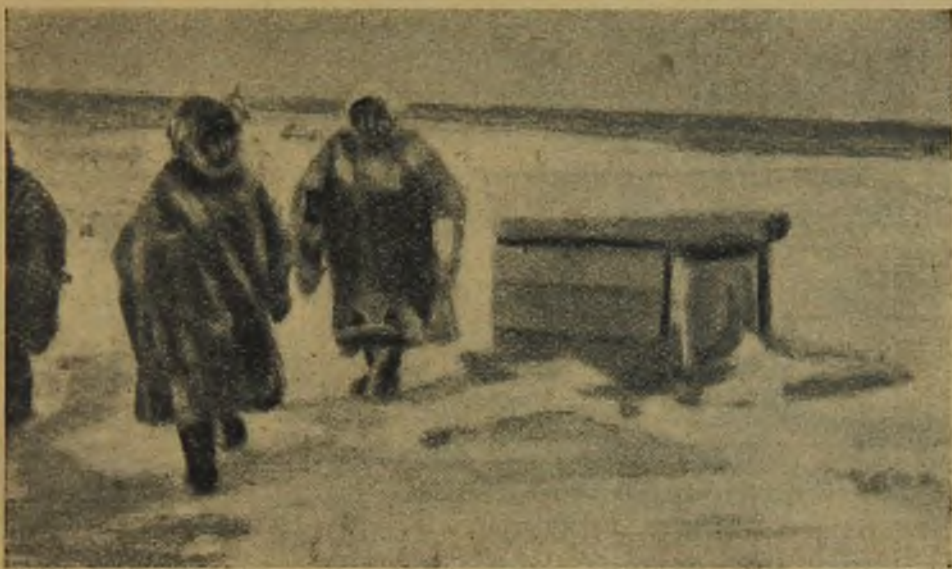
Оставленное для нас продовольствие.