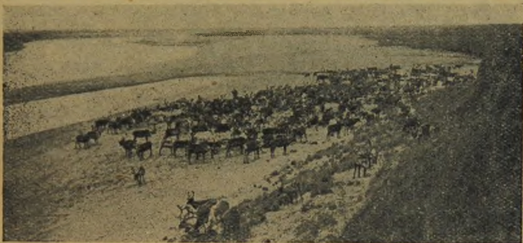
Брод на Юрибее.

Они барахтались на снегу под веселый лай лохматых собак. Наконец, молодой выпустил Марчика и он, не глядя на старуху, молча пошел распрягать оленей.