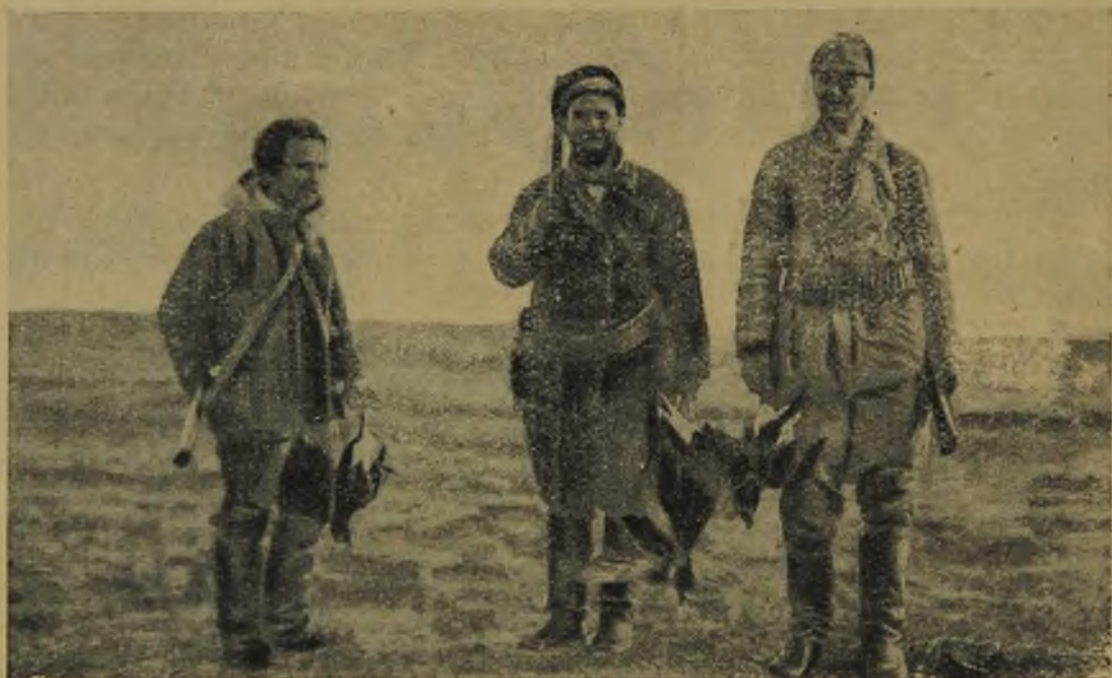
Наши охотники с добычей.

Казарки устраивают свои гнезда в соседстве с храбрым и сильным соколом-сапсаном. Воинственный сокол не трогает