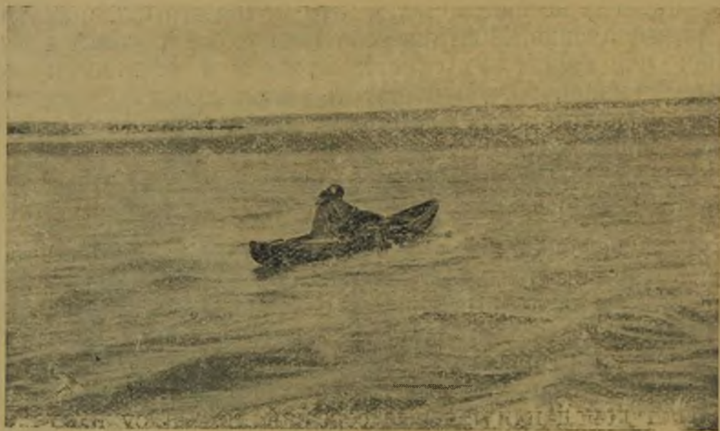
Нирче неводит на Хоссейн-то.

Ачи Яр поймал около 200 огромных нельм. Несколько штук привез нам, рассчитывая променять на сухари, но у нас са-