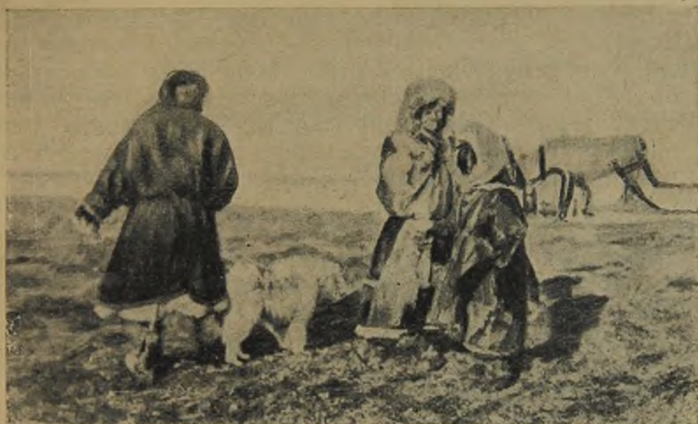
Самоедские дети из рода Ядни.

Однажды утром самоеды стали переправляться через реку. С громкими криками, разбудившими нас, они перегнали вброд оленей. Затем соединили шестами две лодки — ветки, крепко связали их и с помощью этого примитивного паромы перевезли свой скарб. На паром ставились попарно груженные нарты, двое самоедов на противоположном берегу перетягивали его к себе арканом и сгружали нарты. Пустой паром подтягивался другим арканом обратно, снова нагружался и так много раз, пока на прибрежном песке не выстроился длинный ряд нарт.