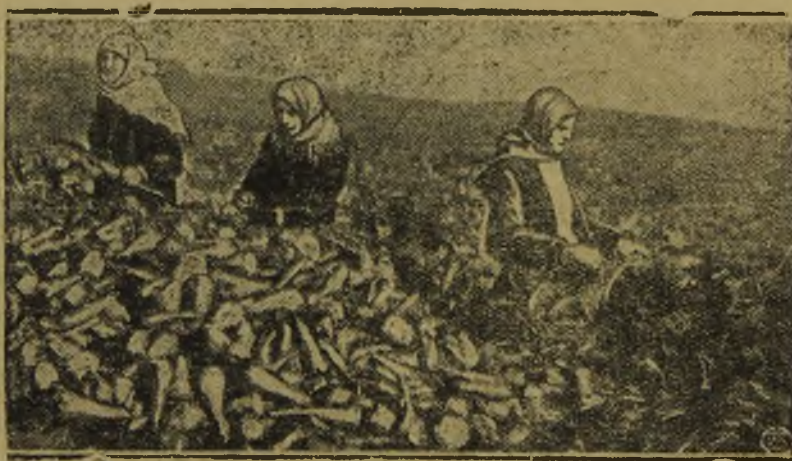
На снимке: снятие урожая моркови

606 хозяйств, свиноколхозов 3, в которых 40 хозяйств.