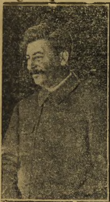
Генеральный секретарь ЦК ВКП(б.) тов. СТАЛИН.

«Профессор» Некрасов пишет: «в кругах госпромышленности оживленно дебатруется вопрос об отпуске оптовым порядком товаров по розничному прейскуранту с той или иной скидкой для оптовых звеньев торговли. Этот метод калькуляции определяется желанием производственных организаций отчислить в свою пользу наибольшую долю прибавочной стоимости продукта». В другом месте он заявляет: «кооперация является представительницей самостоятельного торгового капитала». Вместо теоретического осмысления единого планового