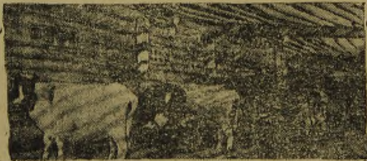
На скотном дворе сель-хоз. комбината

В целях расширения сенокосных угодий для будущего года предполагается проведение расчистки лугов от кустарников. Заросли последних сильно снижают урожай трав. Так Дуванский луг, находящийся при устье Тобола, из 2636 га дает урожай лишь с 1500 га, и то с окашиванием кустов. Но на 100% с этой работой комбинату не справиться, ибо нет достаточного количества рабочей силы. Как выход из этого положения, комбинат предполагает