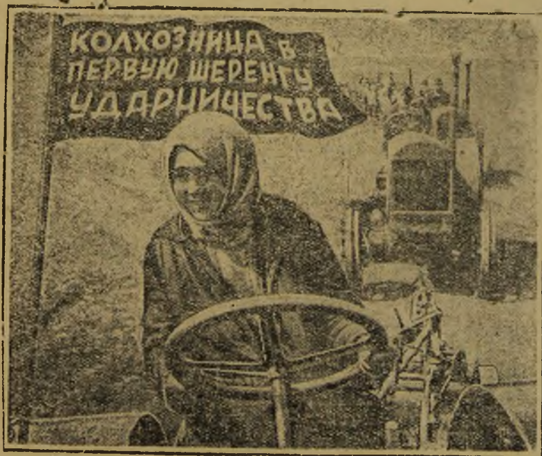
План зяблевой вспашки должен быть выполнен