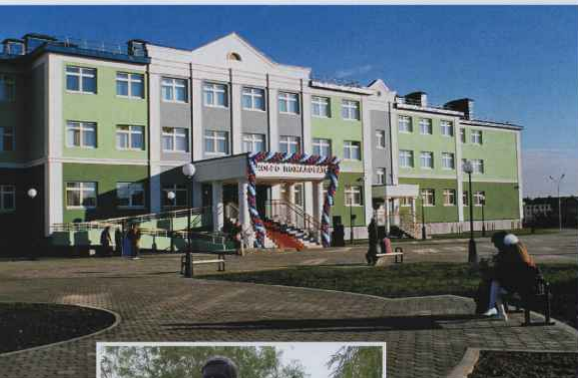
ул. им. Германа Титова