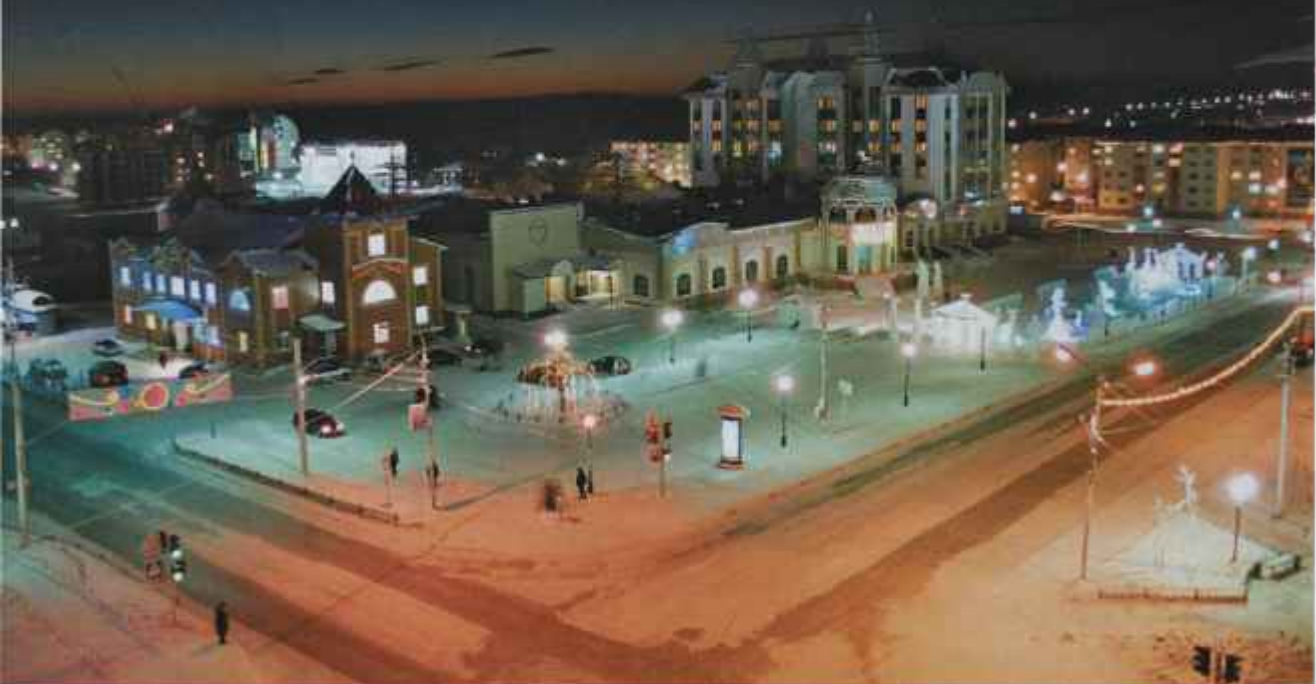
Перекресток ул. им. Чубынина и ул. Республики