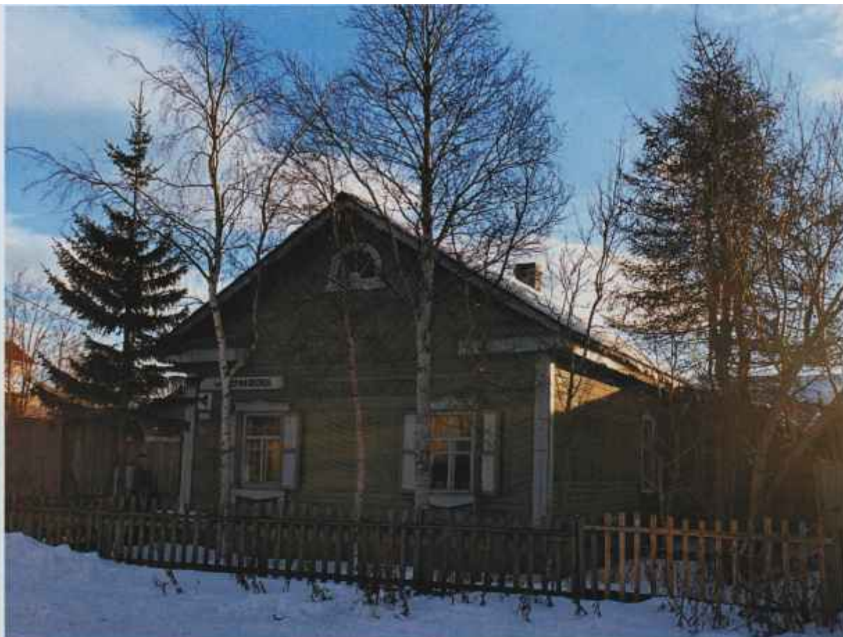
ул. им. Пермякова