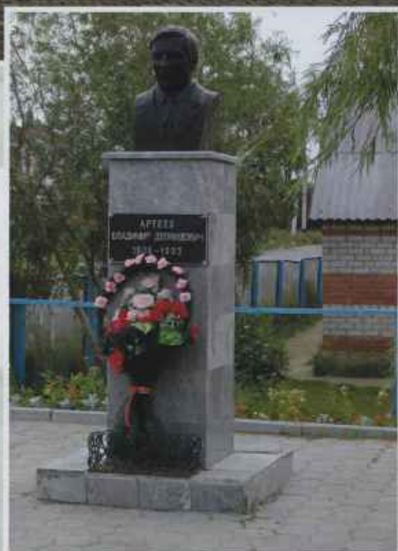
ул. Владимира Артеева