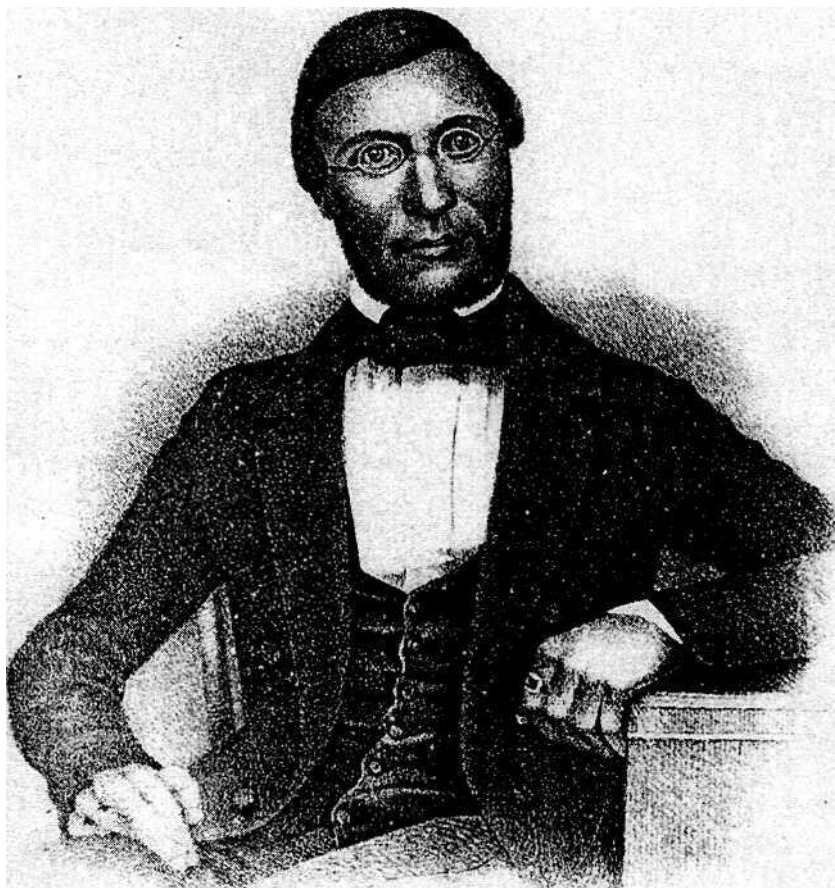
КАСТРЕН Матиас Алексантери (1813 — 1852)