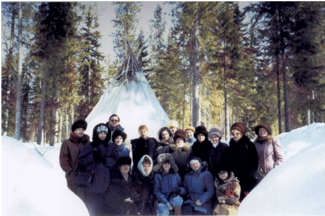
Окружной семинар по экопросвещению. 1997 г.