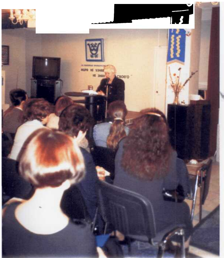
5-е краеведческие чтения. 2001 г.