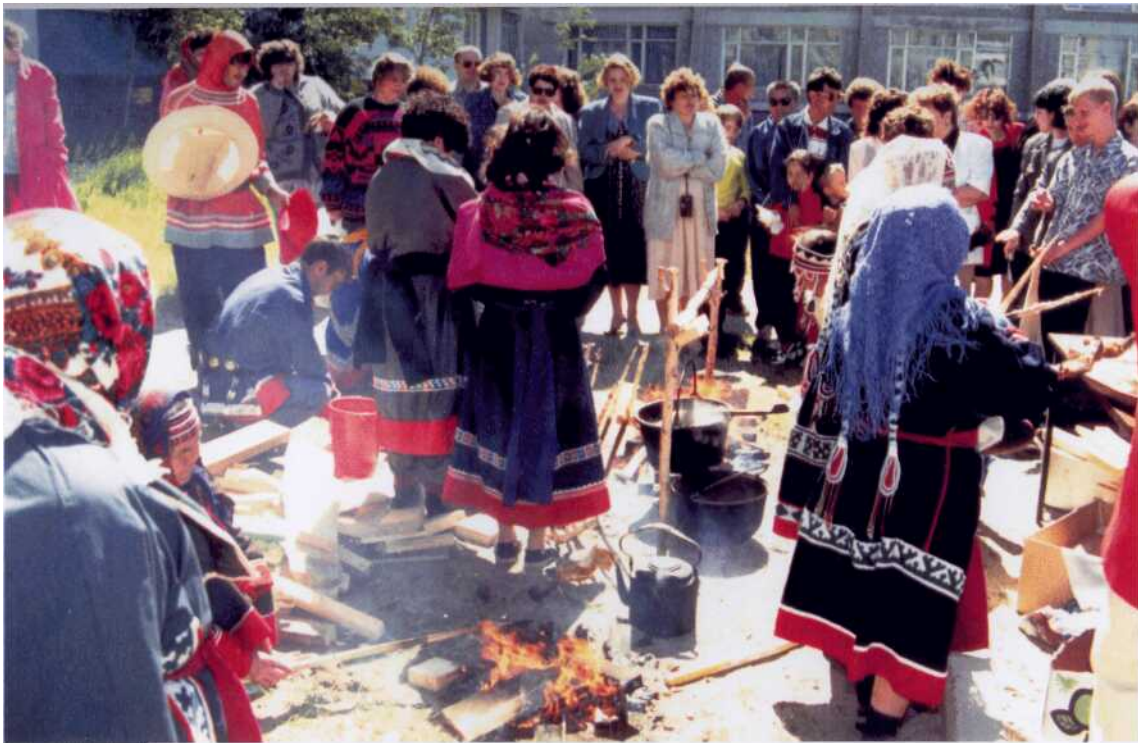
День национальной культуры в библиотеке. 1997 г.