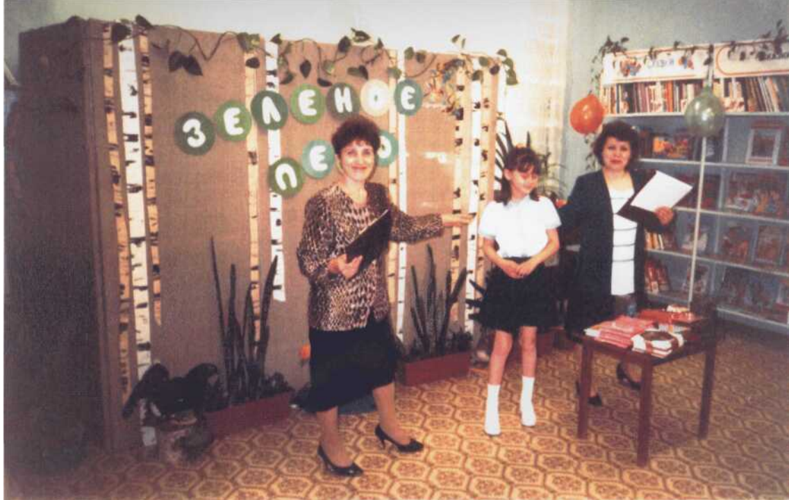
Конкурс на лучшее экологическое произведение "Зеленое перо". ДБ № 2. 1998 г.