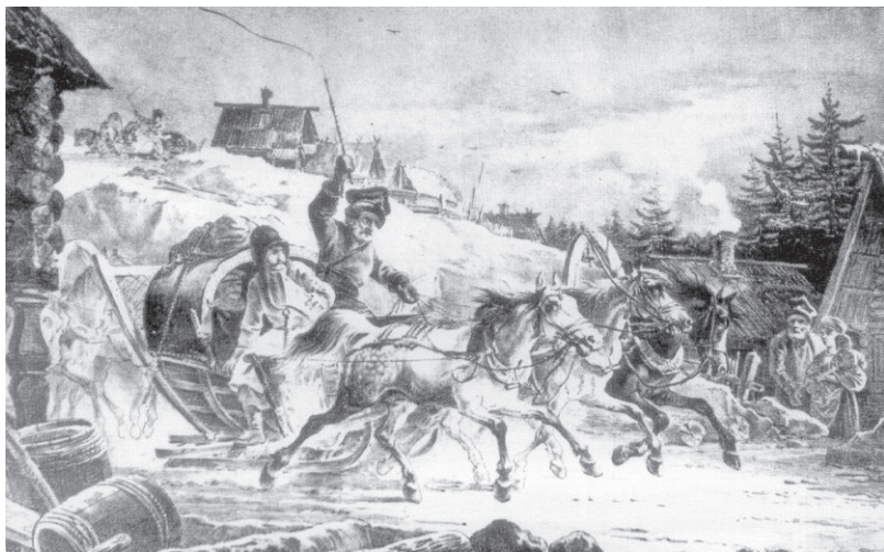
А.О. Орловский. Тройка. С литографии XIX в.

Впрочем, подобные указы мало удерживали лихачей. Значительно более эффективным сдерживающим фактором было, выражаясь современным языком, качество дорожного покрытия