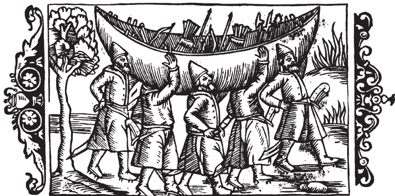
Перенос лодки через волок. С гравюры XVI в.

Я начинаю «ждать», то прохаживаясь до пристани, то присаживаясь куда-нибудь. Моя