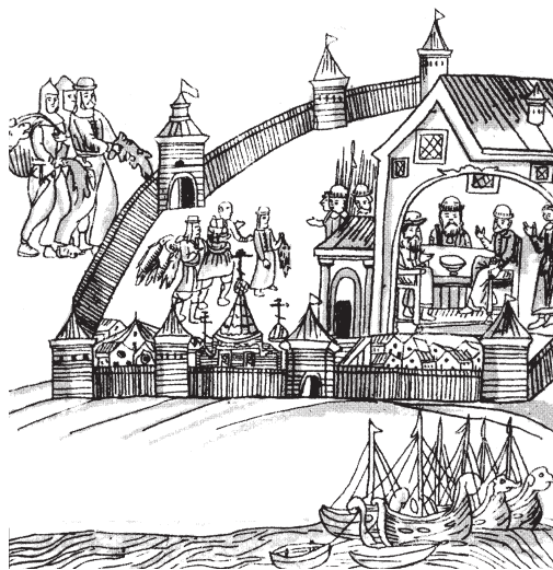
Русский город конца XVI в. в Сибири.

«Погода весь день стоит переменная, пасмурная с небольшим ветром, поэтому переселенцы больше сидят внизу, в барже, предпочитая духоту ветру и дождю. Но вот показалось солнце, один по одному начали выбираться переселенцы из баржи на палубу. Все они разделились на несколько кружков. Женщины оживленно о чем-то толкуют, ребятишки затевают игры в «вершки», а большинство уселись чинно возле матерей и играют в «лепки», которые, по всей вероятности, сделаны или в Тюмени во время долгого «сидения», а то, по-