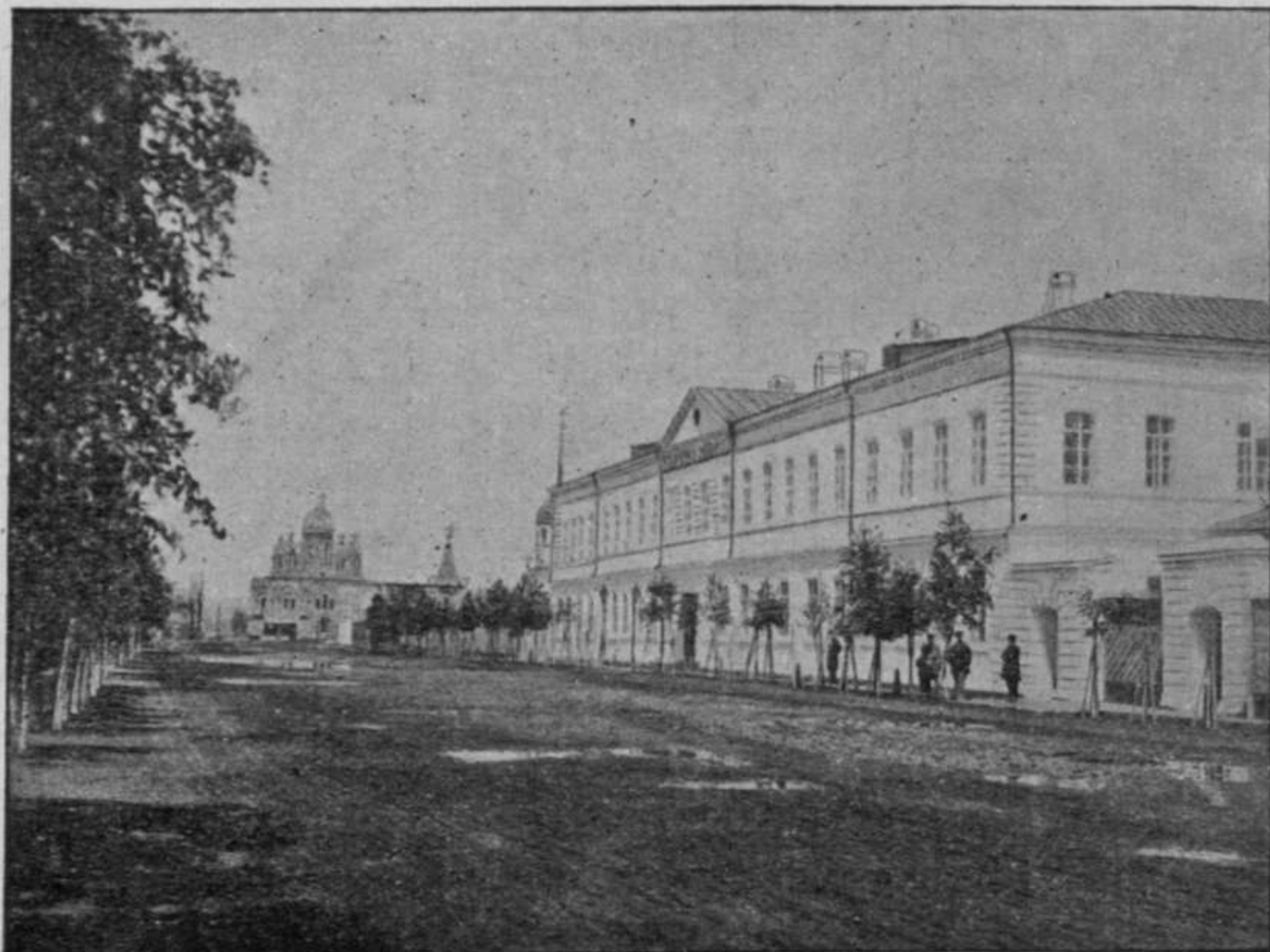
Иркутскъ. — Мужская гимназія и соборъ. (Le gymnase pour les garçons et l'église cathédrale à Irkoutsk).