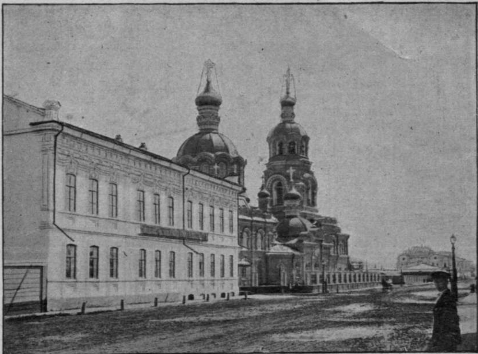
Иркутскъ.—Большая улица и Благовѣщенская церковь. (Grande rue et l'église de l'Annonciation à la ville d'Irkoutsk).