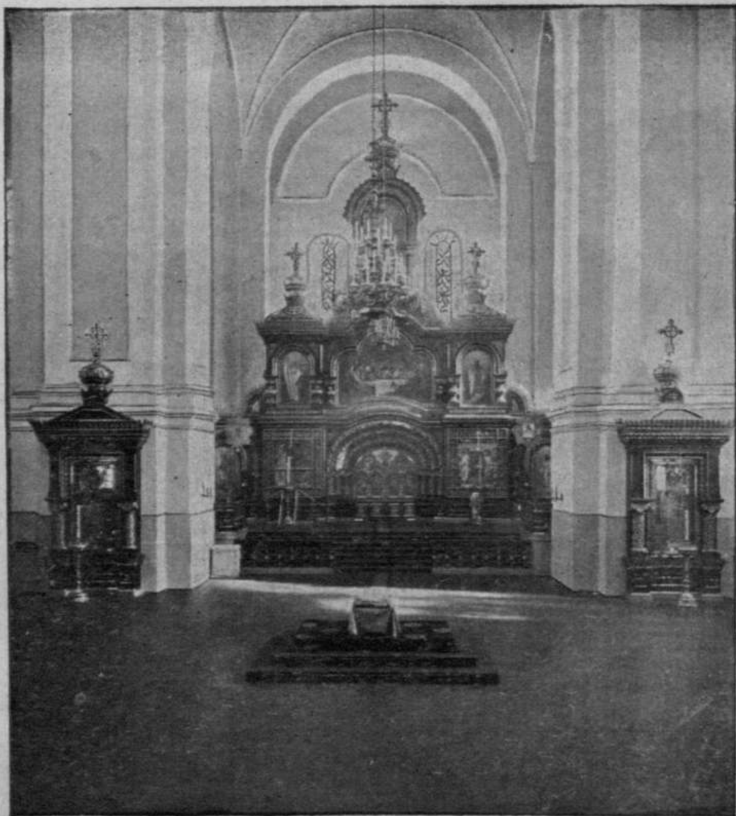
Иконостасъ въ Казанскомъ соборѣ въ г Иркутскѣ. (Iconostase dans l'église cathédrale à la ville d'Irkoutsk).