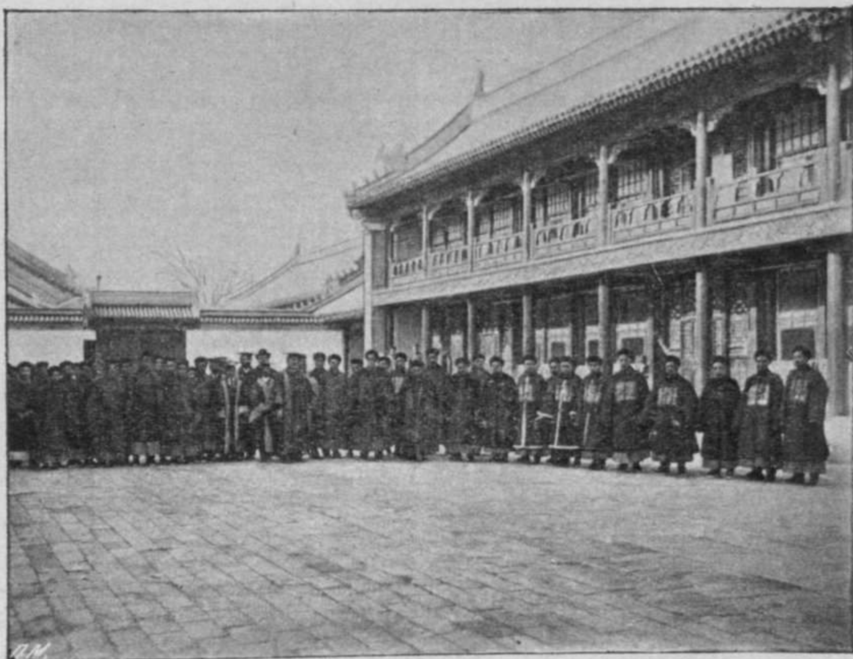
Открытие университета въ Пекинѣ (до войны). Inauguration de l'université de Peking (avant la guerre).