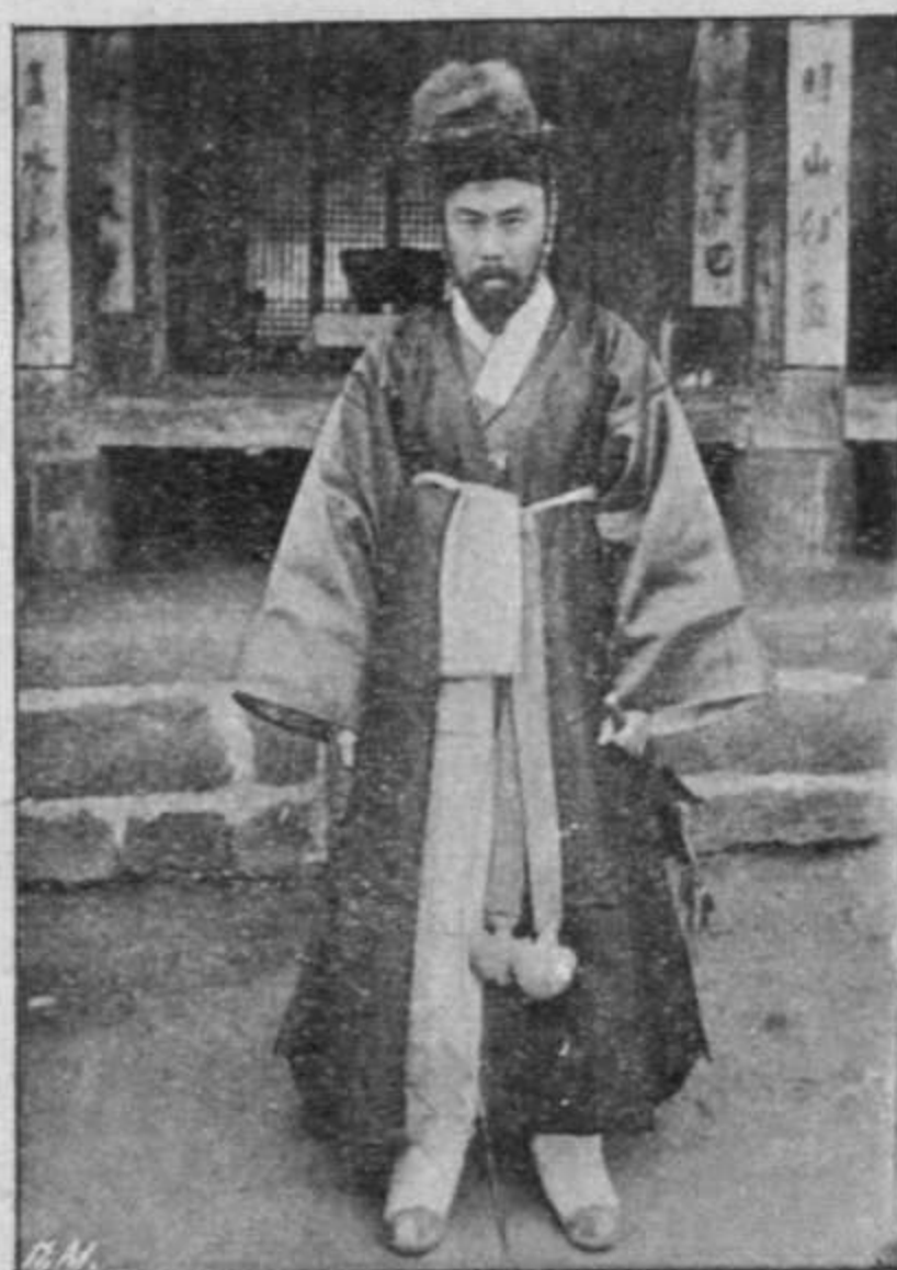
Корейскій мандаринъ. Un mandarin de Corée.