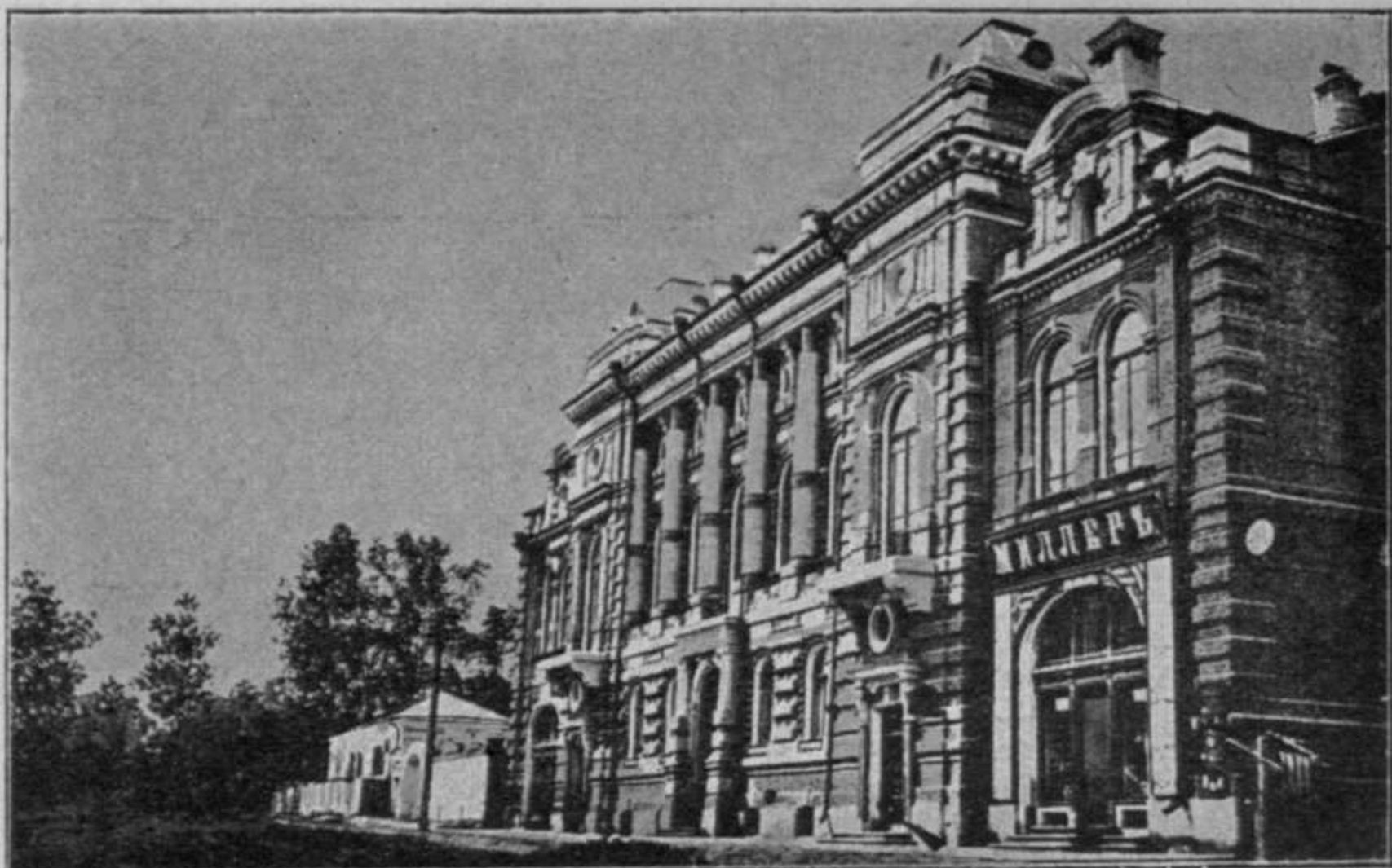
Г. Томскъ.—Зданіе общественнаго собранія.