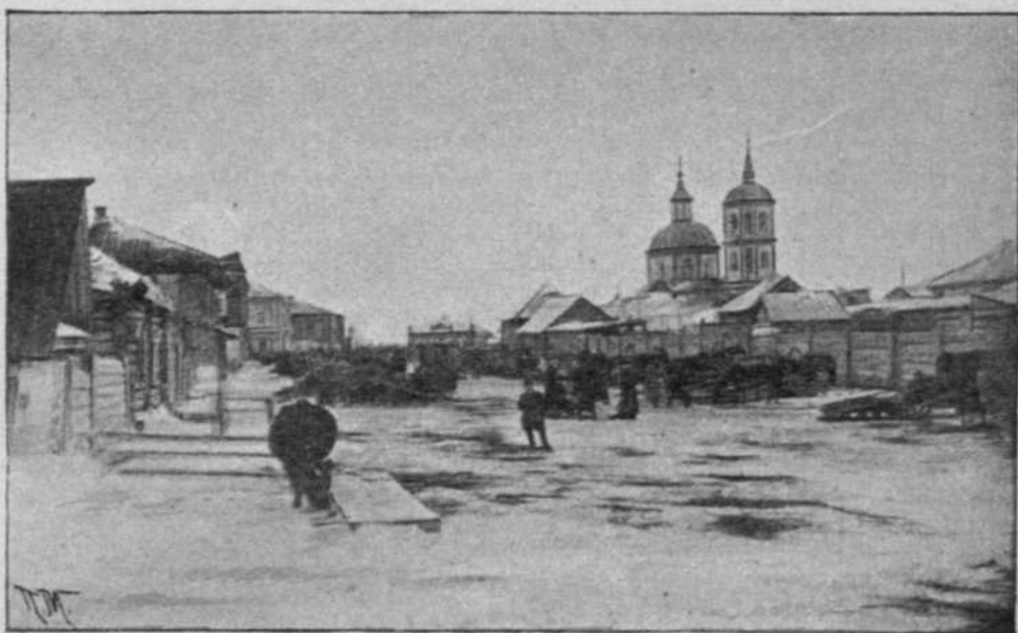
Г. Каинскъ, Томской губ.—Малая Набережная улица.

Vue de ville de Kainsk dans le gouvernement de Tomsk.—Rue petite Nabérégniaia.