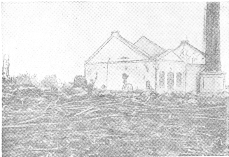
Вид одного из разрушенных интервентами заводов.

Помимо открытого и замаскированного колониального грабежа интервенты нанесли колоссальный ущерб народному хозяйству Севера разрушением городов, селений, заводов, всевозможными поборами и реквизициями, истреблением скота, посевов и т. д. По неполным подсчетам Общества содействия жертвам интервенции, хозяйничание интервентов обошлось