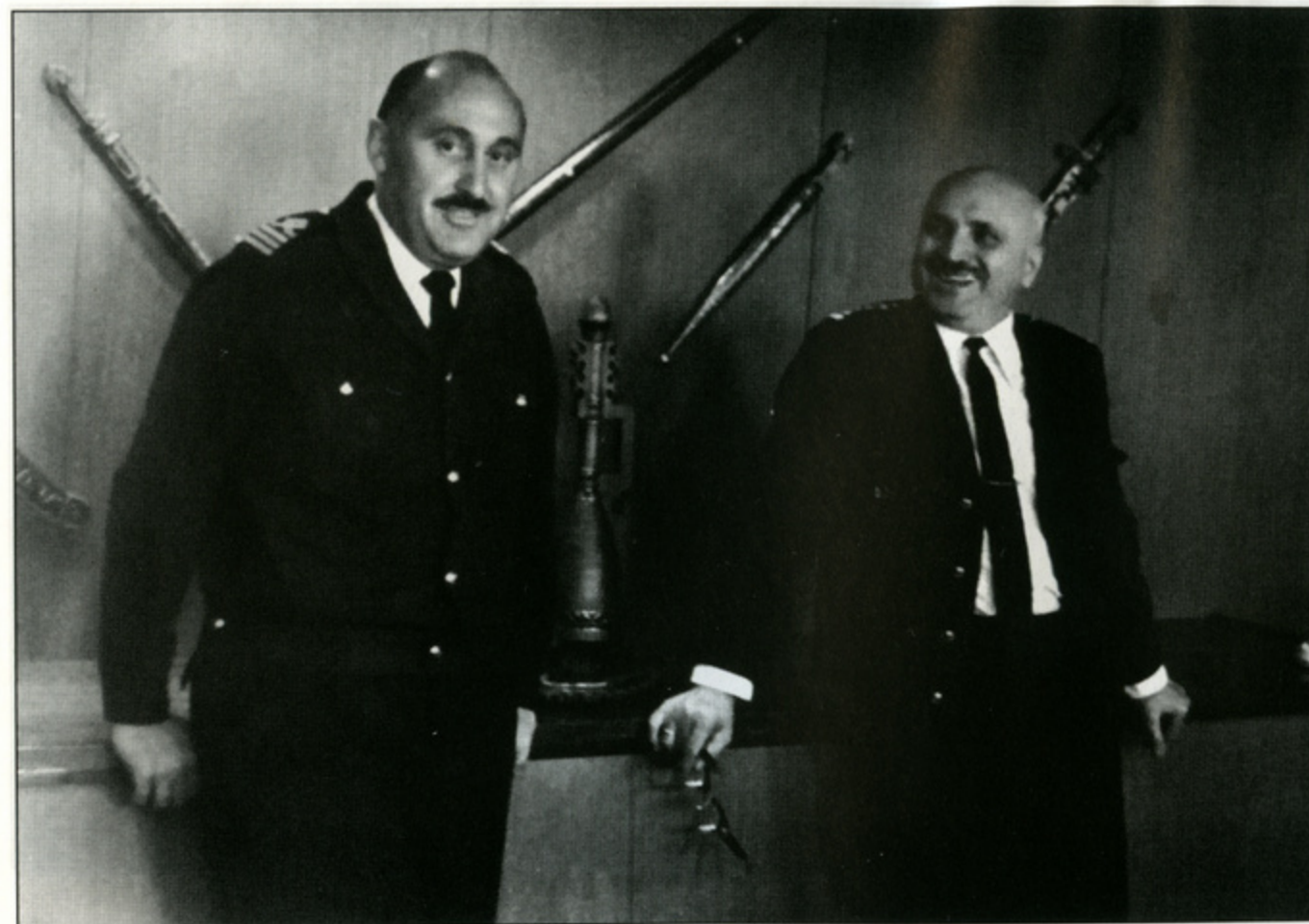
На борту атомохода «Арктика», в каюте капитана во время плавания в Арктике. Каюта украшена оружием из фонда Краевого музея Северной Осетии - Алании.