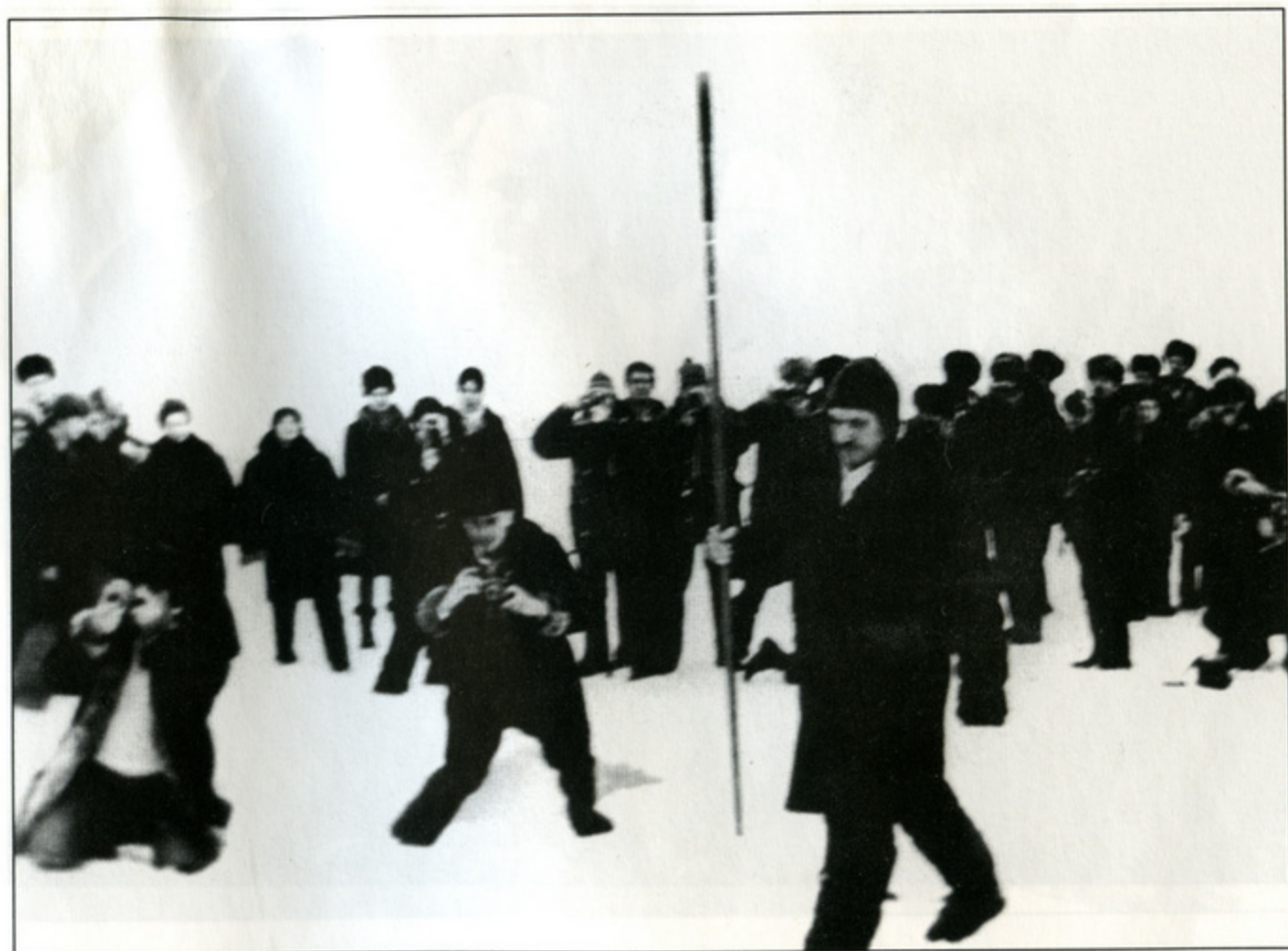
Водружение флажштока на Северном полюсе.