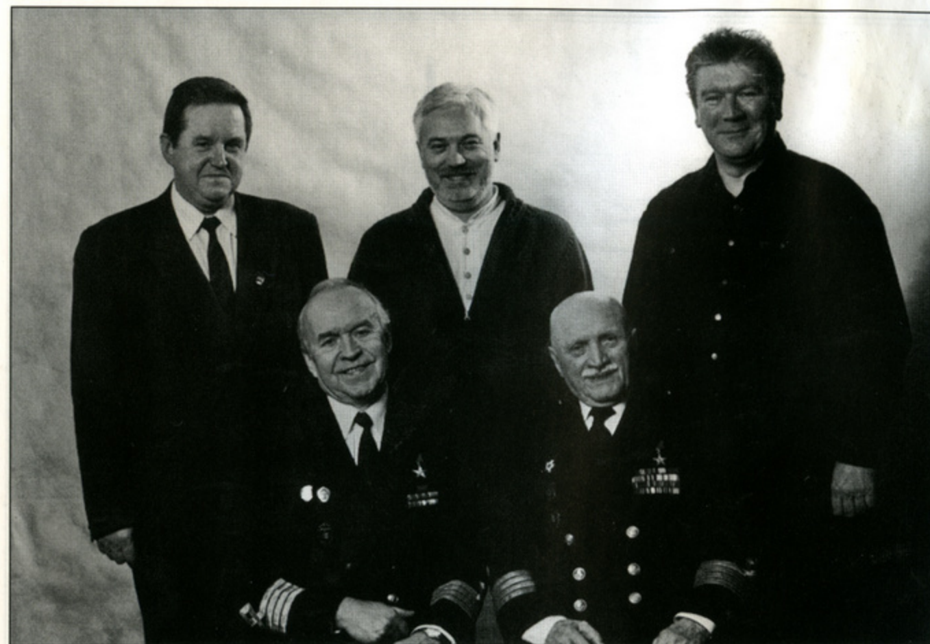
В редакции газеты «Версия» («Совершенно секретно»)