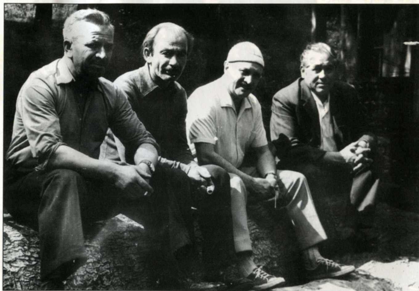
1977 год С земляками на родине в Осетии