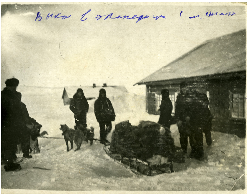
Полярная станция Мыс Шмидта. Старт экспедиции.

Наконец-то двинулись в путь. Сегодня ровно в 13.00 вышли. Оставили позади полярную станцию Мыс Шмидта. Всё уместили на одной нарте, увязали брезентом. Для двенадцати собак груза 300–320 кг достаточно, но иногда и кто-нибудь из нас может сесть, каюр обязательно едет... В 18.00 остановились у подножья сопки, довольно высокой, разбили лагерь. Палатка хорошая, тепло, особенно когда горит печка, но и вообще тепло на воздухе сегодня. Поужинали из собственной кулинарии. В мешки – и в 21.00 спим. t -15,4^{\circ}\text{C} , еле-еле дышит NWW.