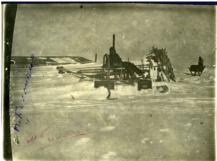
На мысе Биллингс.