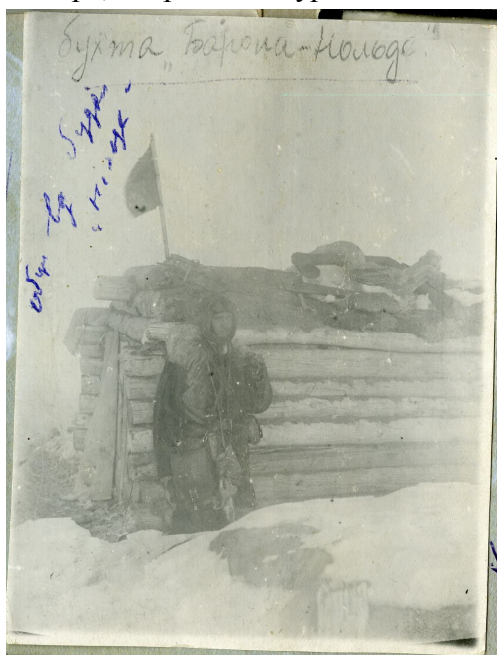
В бухте Нольде.